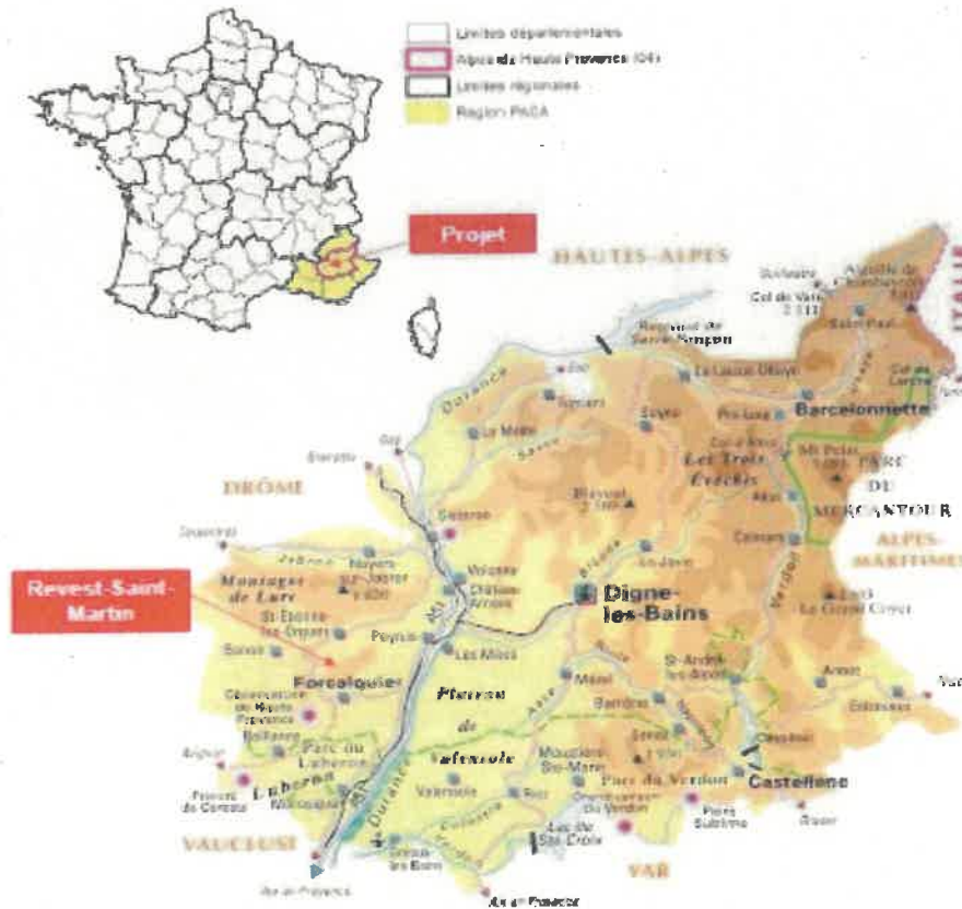
Figure 1: localisation de la commune