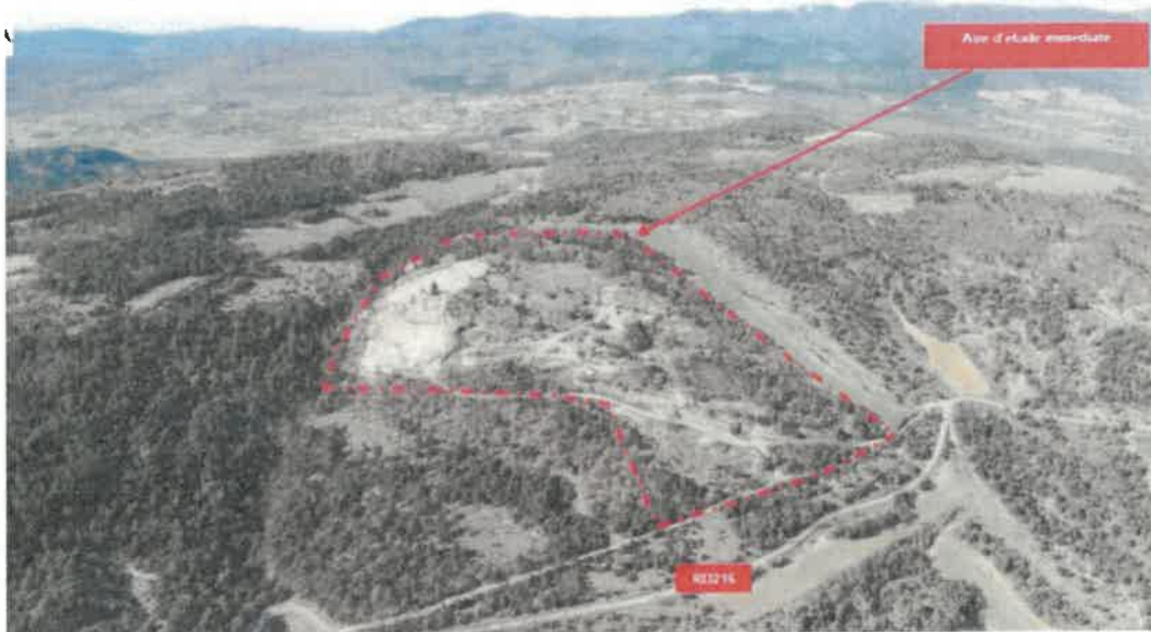
Figure 2: vue du site de projet